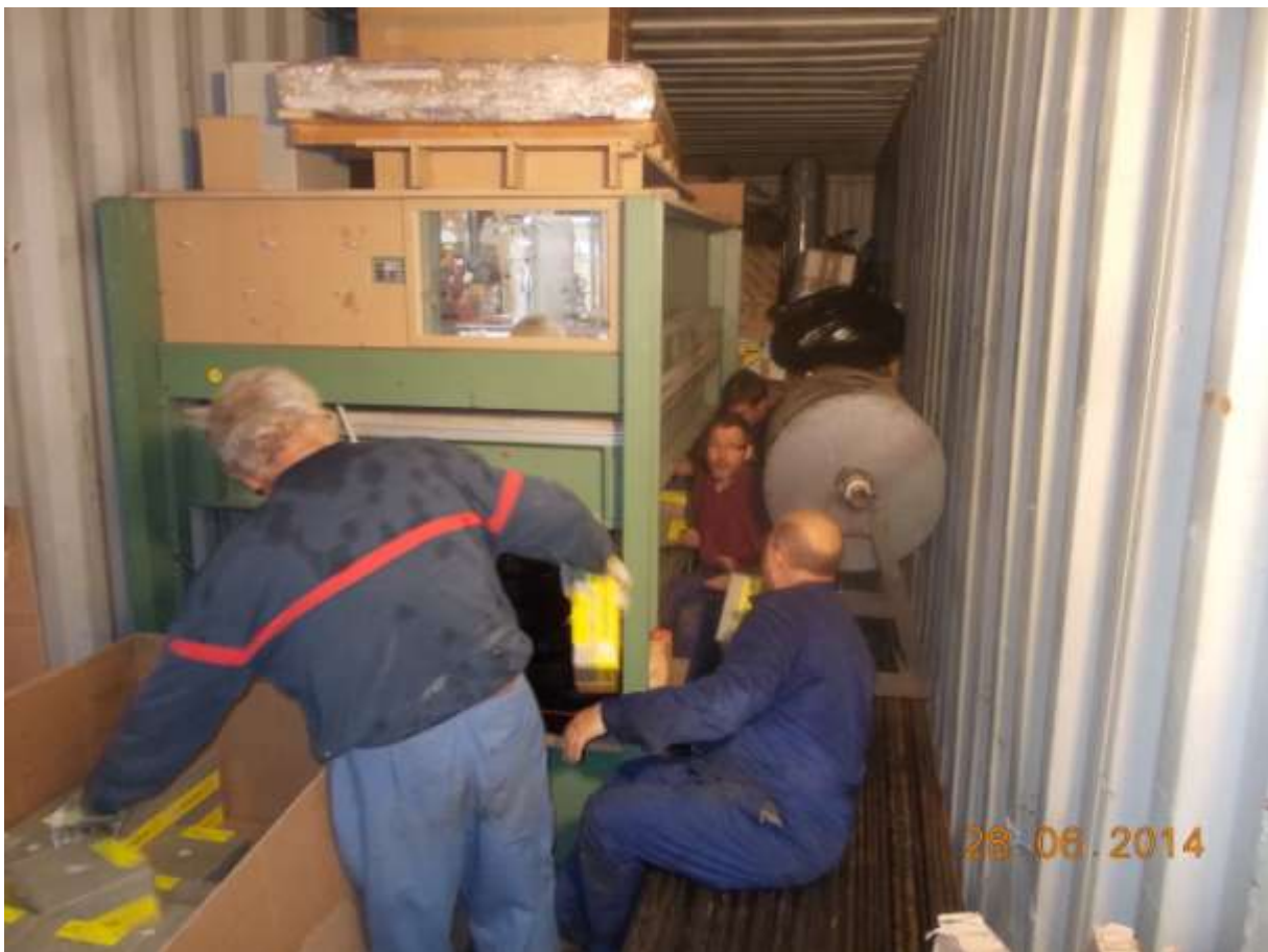
faut souvent faire la chaîne pour utiliser au mieux la place disponible