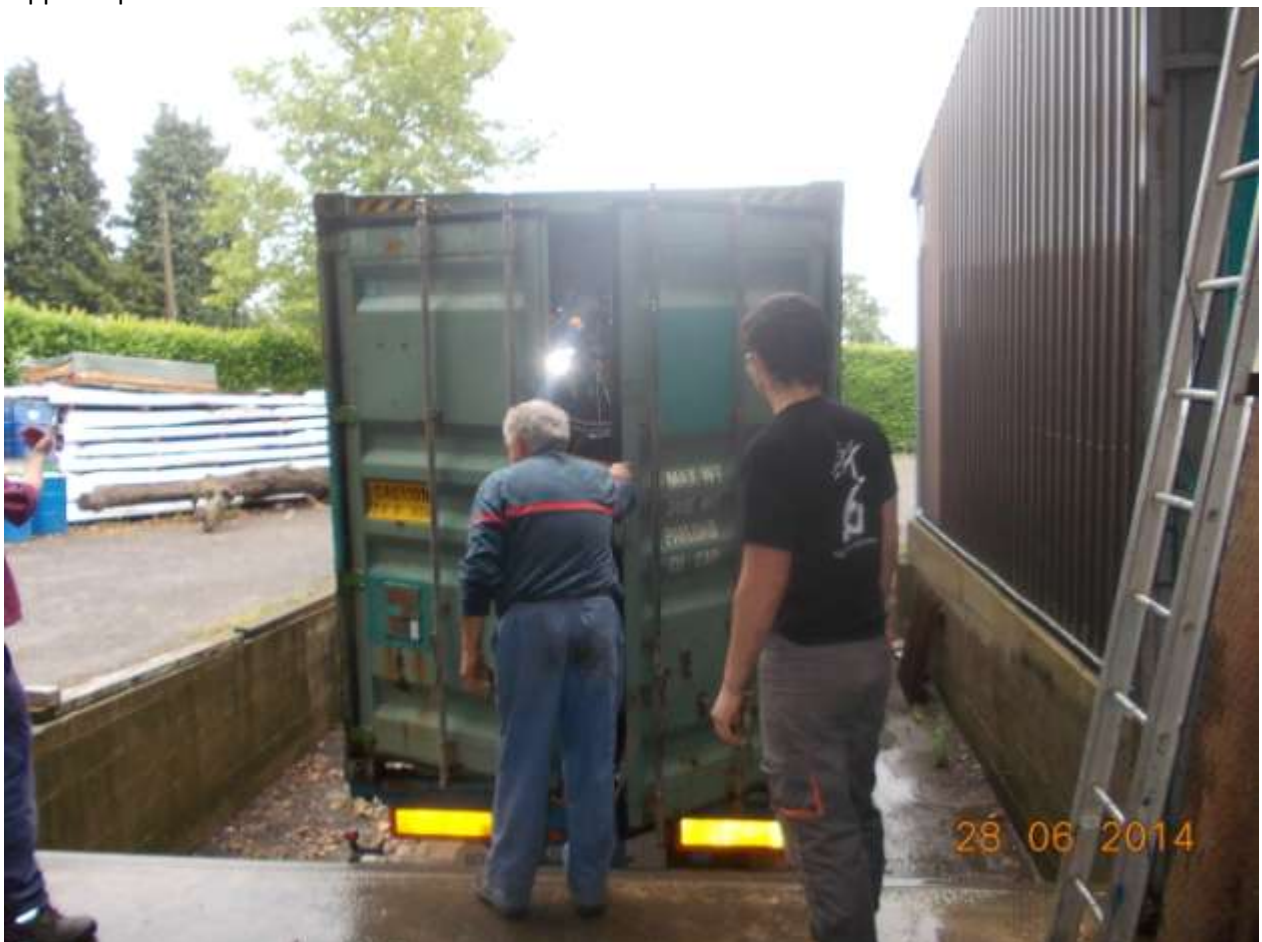
Fermeture de la porte, un moment bien agréable