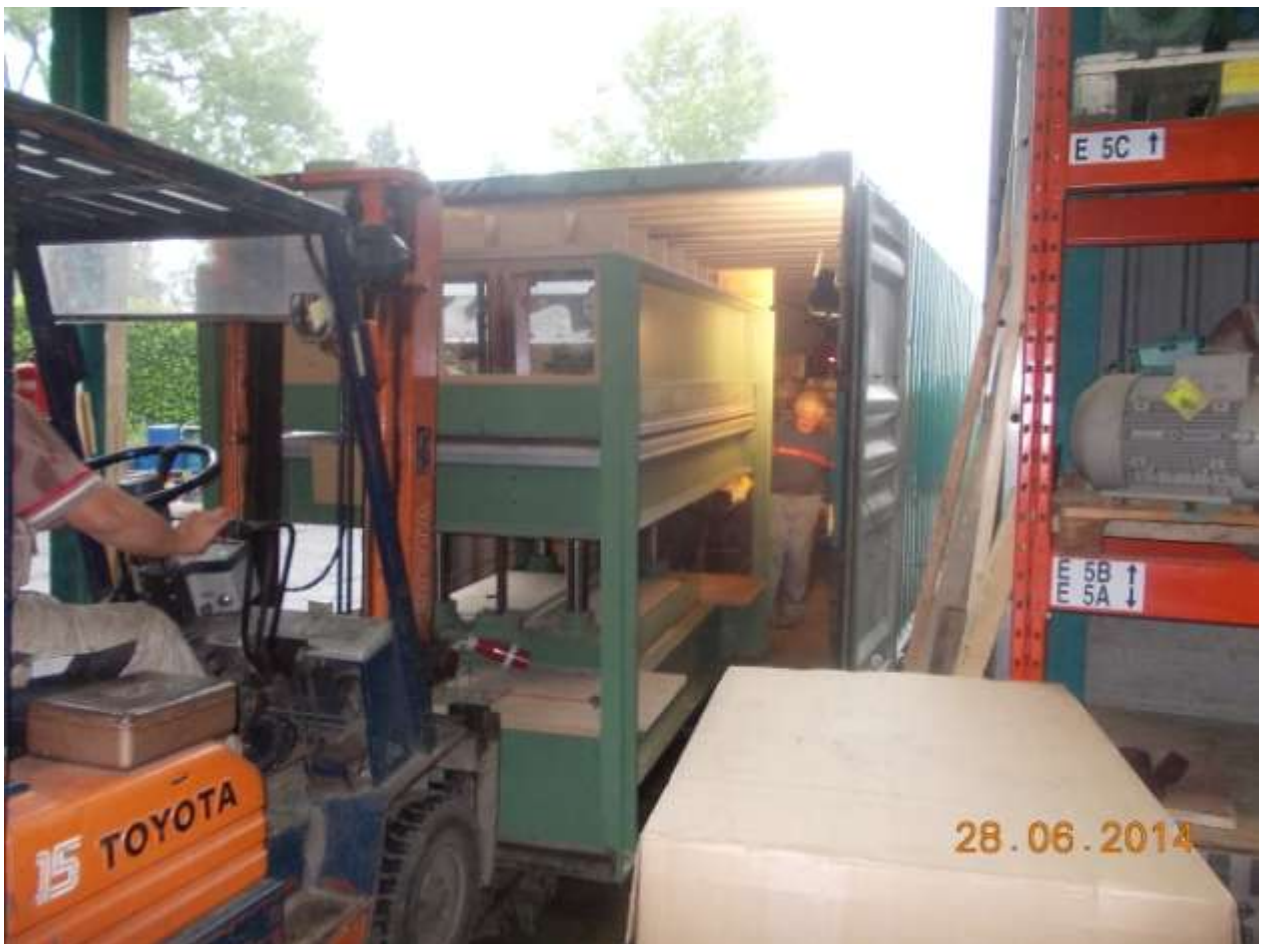
Chargement d'une presse