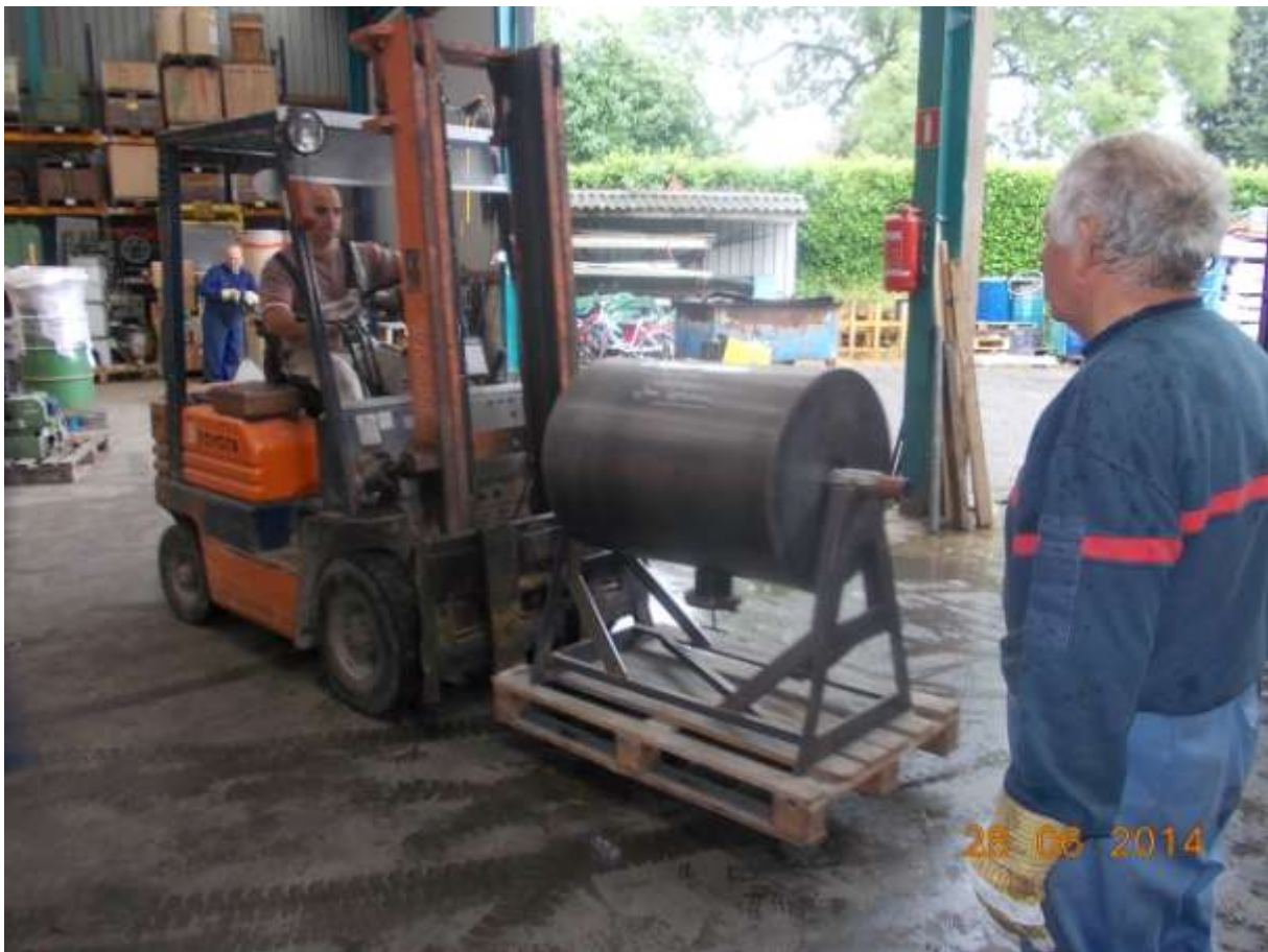
Un torrificateur à arachide qui sera chauffé grâce aux gaz d'échappement du moteur diesel